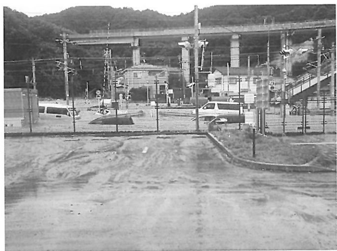
水尻駅北で土砂に埋まった車(坂ベイサイドビーチ駐車場から) 20180707

断水が長引くと、トイレ、洗濯に支障が出ます。給水所の水はトイレや洗濯に使用するのには問題ありません。飲料水はペットボトルの水があればいいですが、給水所の水をそのまま利用するのは危険で、一度沸かす必要があります。食器を洗浄する水も同様です。感染症が心配されますので、食事は過熱して食べるものか、包装食品を利用するのが安全で、洗浄のいらない使い捨ての食器を利用してください。今回のように猛暑日が続くと、熱中症の被害が出ます。水分と適量の塩分を補給して、できれば29℃以下にすることが勧められています。メディアでも盛んに情報提供されていますので、参考にして頂きたいと思います。