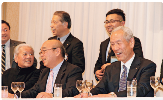
2018年の忘年家族例会にて

もう一つの思い出は朝の掃除。糧配の社長になられてからは会社や事務所の周辺の清掃をされておられ、私が通りがかりにクラクションを鳴らすと、箒を持った手を挙げ笑顔で返されたのが最近の事のように思い返されます。